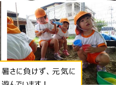
暑さに負けず、元気に遊んでいます！