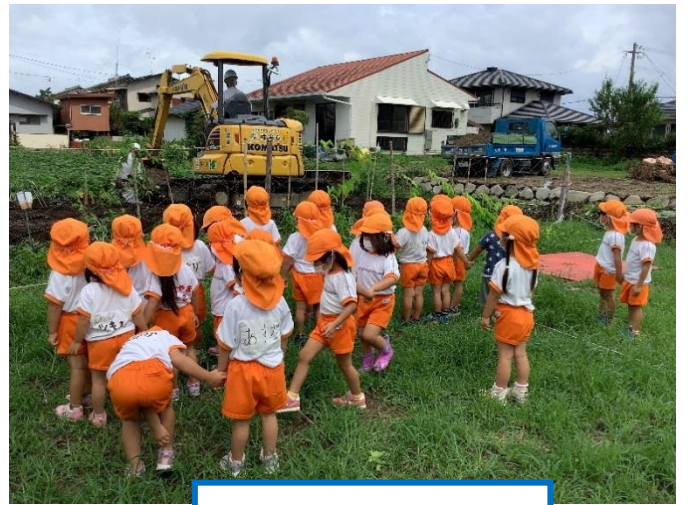
ショベルカーがお仕事をしていました。かっこいい！