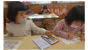
好きな遊びをお友達と楽しんでいます