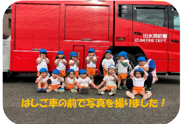
はしご車の前で写真を撮りました!