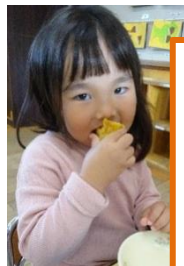
焼き芋 おいしかったです