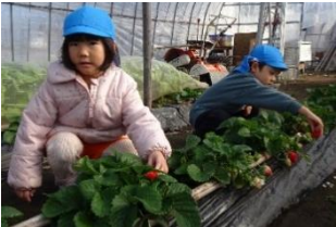
いちご収穫 今年は大粒が多いです