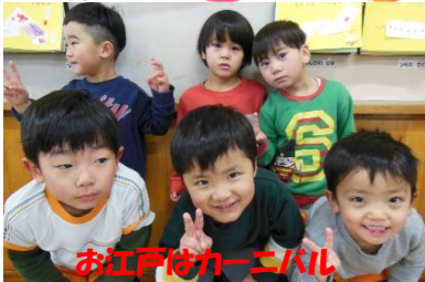
お江戸はカーニバル